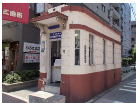
地域安全センター 二番街と三番街の間にあり、大正15年に建てられた鉄筋コンクリート造の建物で平成19年まで警視庁最古の現役交番でした。