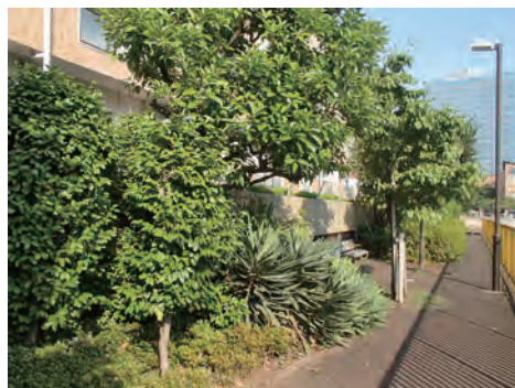
月島川みどりの散歩道 南西の月島川沿いの緑道、北西側の隅田川沿いには隅田川月島緑道があります。