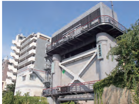
月島川水門 隅田川と朝潮運河を結ぶ月島川にある水門で昨年度に耐震工事が完了しました。