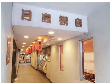
月島観音 以前は路地に入ったところだったそうですが現在は月島西仲通り三番街にあるビルの一階にあります。