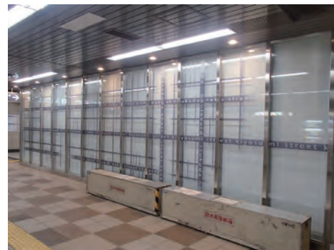
月島駅構内 月島駅構内の壁面に月島の各通りがデザインされていました。