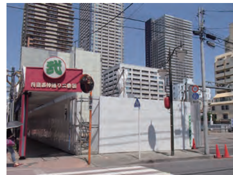
再開発 月島西仲通り二番街の南側は現在再開発中です。