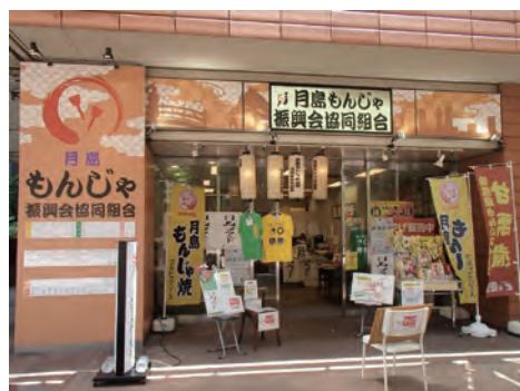
月島もんじゃ振興会協同組合 とても目立つので月島駅からもんじゃストリートに歩いて行くとまず目に入ってきます。