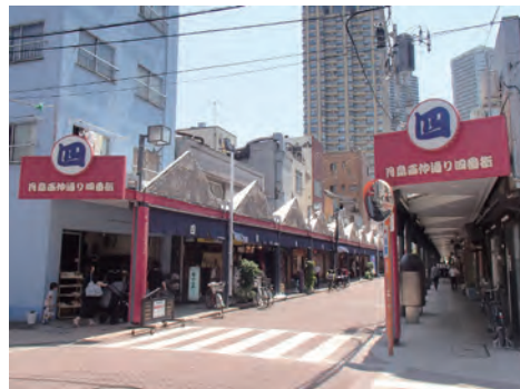
西仲通り商店街 一番街から四番街まで統一された赤のアーケードが伸びています。