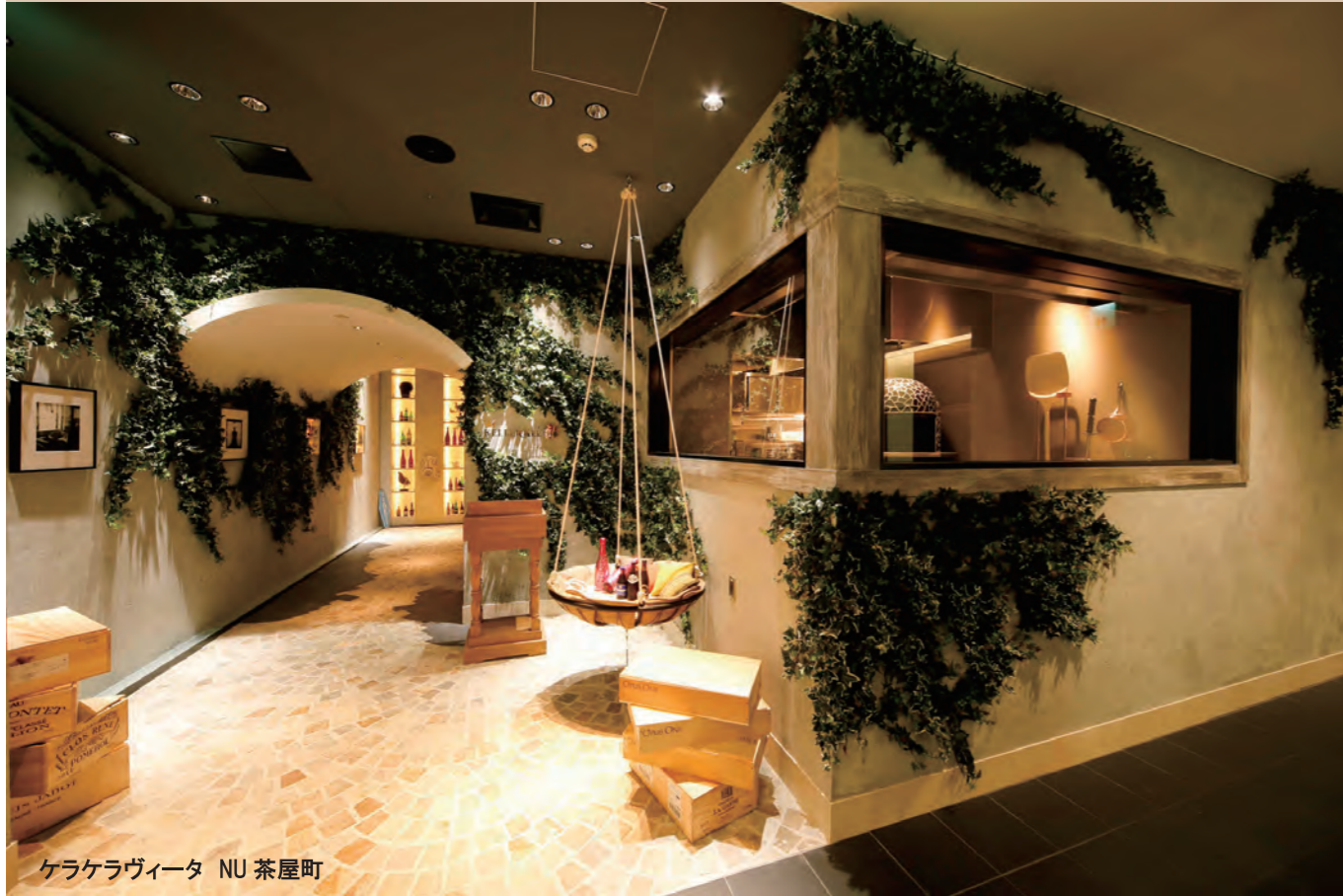
ケラケラヴィータ NU 茶屋町

高島屋スペースクリエイツ株式会社は 商業施設・ホテルなどの上質な空間をプロデュースする 高島屋グループ企業です