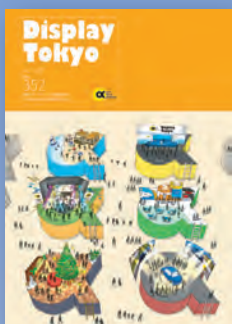
表紙デザイン 江口真希 / 株式会社ジールアソシエイツ

ディスプレイ業界が扱う事業の幅 広さを様々なロケーションを描くこ とで表現。 デジタルな表現が多かったので、 原点に立ち返り、あえてアナログ で親しみやすい表現をした。