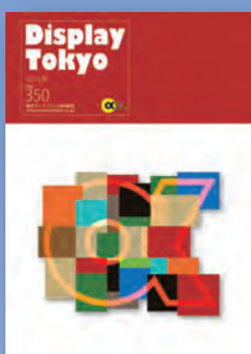
表紙デザイン 川村 渉 / 株式会社ジールアソシエイツ

十人十色。 様々な人のアイデア(色)が集まることで、+αの発想は構築され、世界は作られていることを表現しました。