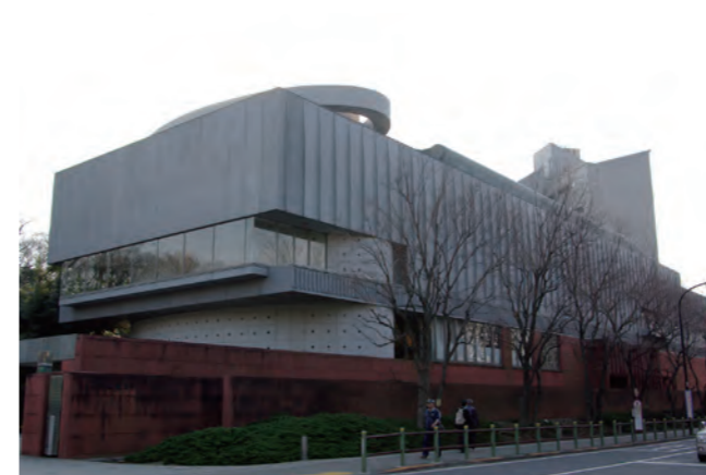
東京藝術大学大学美術館