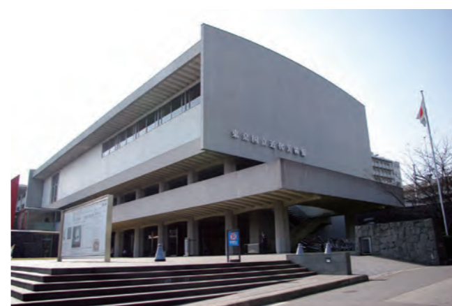
東京国立近代美術館