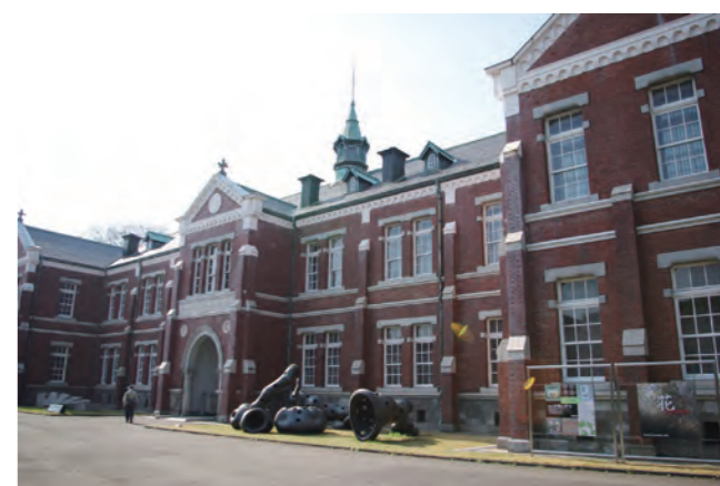
東京国立近代美術館 工芸館