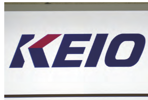
京王電鉄株式会社