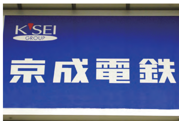
京成電鉄株式会社