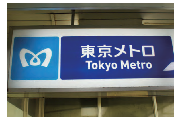
東京地下鉄株式会社 (東京メトロ)