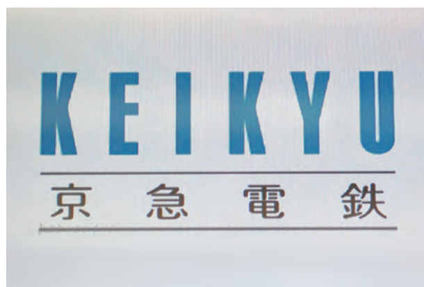
京浜急行電鉄株式会社 (京急)